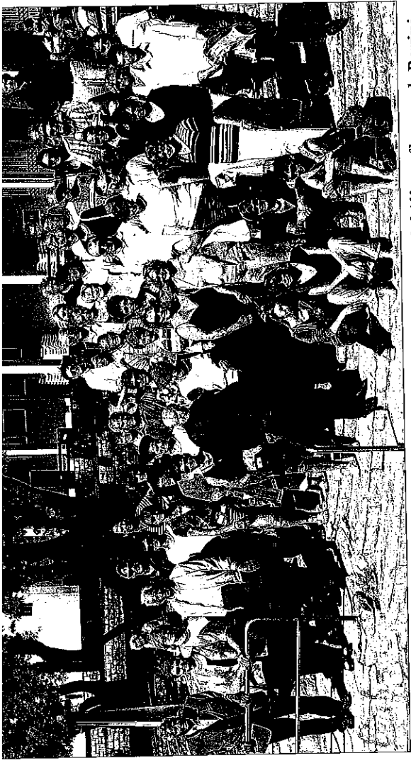
Ein Teil der Leserreise-Gemeinschaft nach der Rückkehr vom Schiffsausflug nach Rovinj.