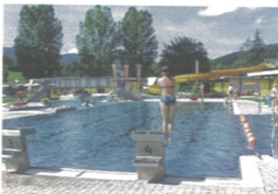
Das Freibad in St. Paul beendet erst nach Ende der Sommerferien die Badesaison

WOLFSBERG. Bis einschließlich 3. September hat das Sekretariat der Kleinen Zeitung in Wolfsberg geschlossen. In unserem Regionalbüro ist in dieser Zeit weder ein Abo- und Vorteilsclub-Service, noch Ö-Ticket-Verkauf möglich. Die Redaktion ist durchgehend besetzt.