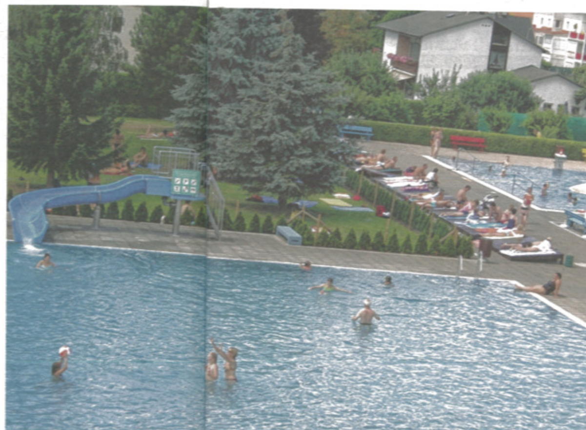
Trotz Schönwetter waren vergangene

Gut besucht war das Stadionbad im Juli, in den anderen Monaten blieb man hinter den Erwartungen. Zwölf Mal kamen pro Tag sogar über 3000 Gäste. „Wer noch Blockkarten hat, kann diese