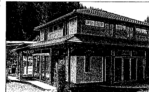
bis zum fertigen Haus ist sehr kurz.