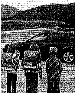
...hönweg müssen über ...liche Kreuzung gehen KLZ