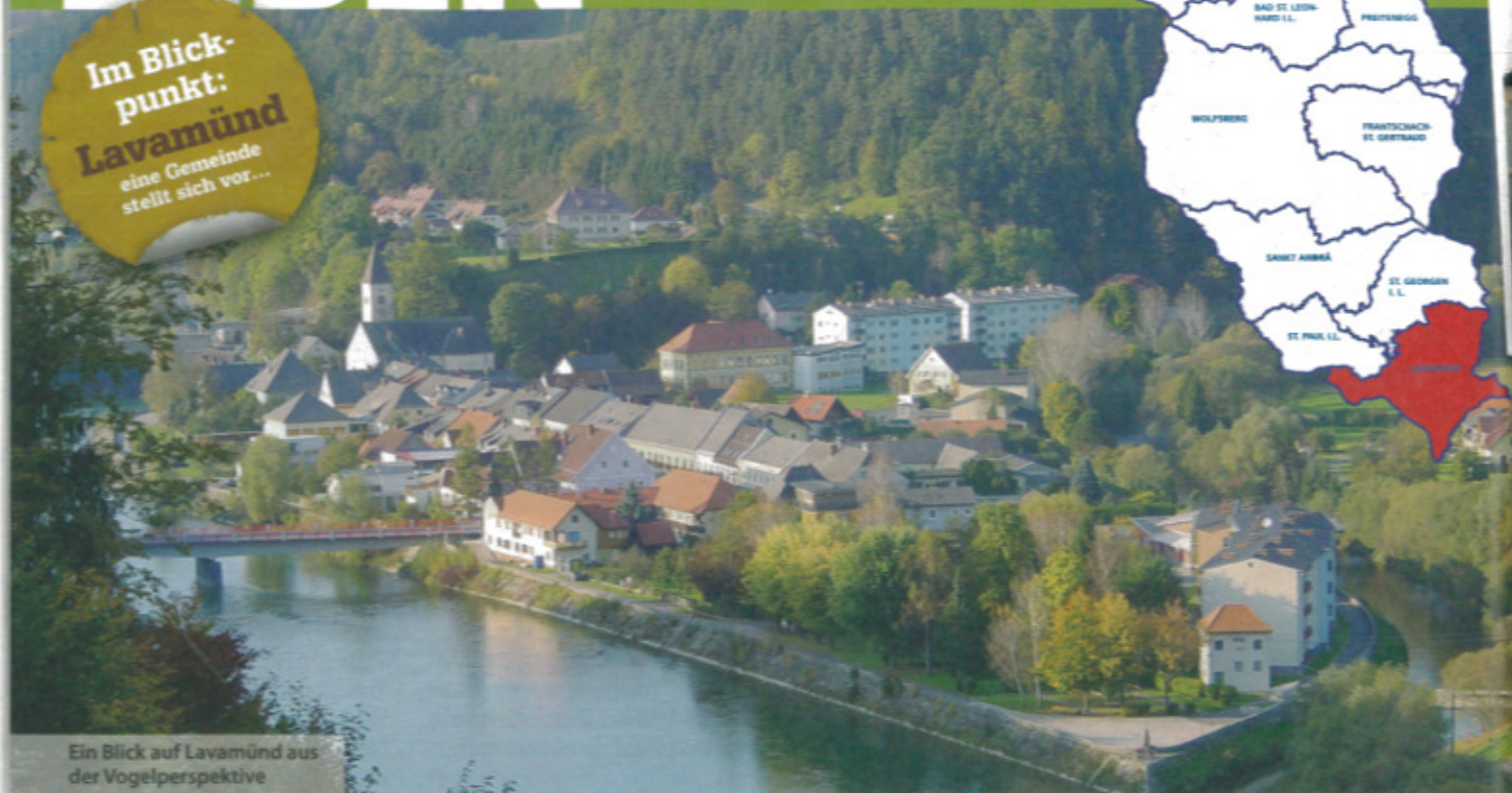
Ein Blick auf Lavamünd aus der Vogelperspektive