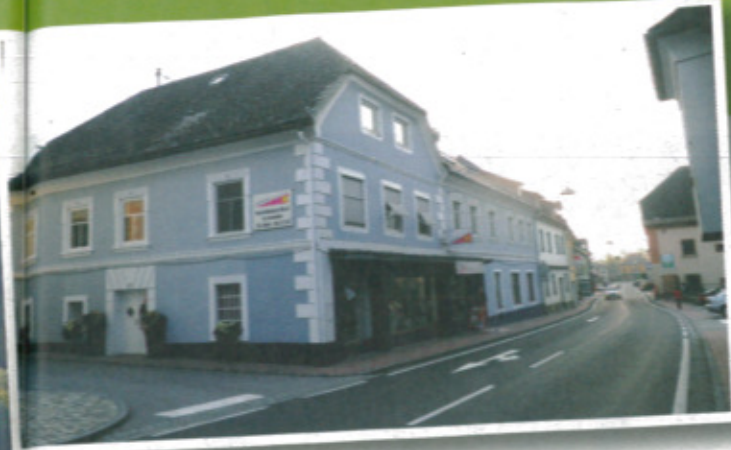
Die Einfahrt zur südlichsten Gemeinde des Tales

der Lavanradweg R10. „Ein Großteil der hier ansässigen Betriebe profitiert von den Radfahrern. Unsere Radwege sind sehr gepflegt und erfreuen sich nicht nur bei Radlern, sondern auch bei Rollerbladern großer Beliebtheit. Vermehrt trifft man hier Radler- und Skatergruppen als auch Schulklassen aus Slowenien an.“