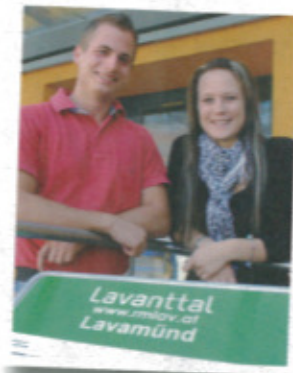
Lavamünd ist eine lebenswerte Gemeinde