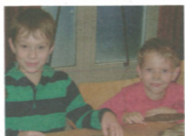
Die Kleinsten der Gemeinde bastelten mit den örtlichen „Kinderfreunden“