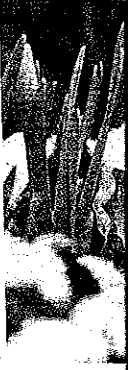
Der Schnee nicht ganz beweist

men: Geben Sie auf der Website www.woche.at/kaernten im Suchfeld (rechts oben) den Webcode „512747“ ein. So gelangen Sie zum Bericht, wo Sie dabei einfach Ihre Bilder hochladen können. Bitte versehen Sie