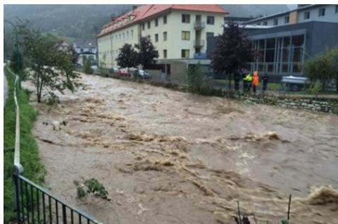
In Frantschach-St.Gertraud führte die Lavant Hochwasser

Regenfälle am Wochenende sorgten für Großeinsatz der Feuerwehren. Zahlreiche Keller mussten ausgepumpt werden. Die Packer Bundesstraße bei Limberg bleibt laut Landesgeologe noch bis Dienstag früh gesperrt.